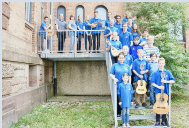
Das Kinder- und das Jugendorchester

Der Verein gratuliert den teilnehmenden Musikern zu diesen herausragenden Ergebnissen und bedankt sich gleichzeitig bei den Ausbildern und Dirigenten für die intensive und gelungene Vorbereitung auf diesen Wettbewerb.