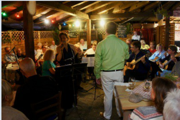
Impressionen von vergangenem Jahr.

Am Freitag, den 15. Juni lädt das Freizeitorchester des Vereines unter dem Motto „Sunset Serenade“ zu einem gemütlichen Sommerabend ein.